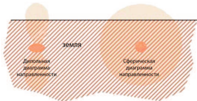
Диаграмма направленности маркеров Greenlee

Маркеры со сферической диаграммой направленности имеют расположенные в двух плоскостях резонансные контуры, благодаря чему электромагнитное поле вокруг маркера имеет более равномерное распределение. Такие маркеры легко закладывать и искать.