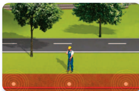
Трассировка линейных участков